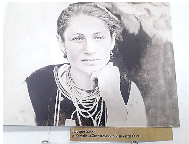
Портрет жінки с. Козубівка Хорольський р-н. початок ХХ ст.

Фотовиставка невдовзі помандрує Полтавщиною, лубенцям же пощастило найбільше: вони мають можливість споглянути світлини найпершими. Тож варто поспішити, привести до галереї мистецтв дітей, молодь аби ті відчували естетичність одягу наших пращурів та зрозуміли автентичність при-